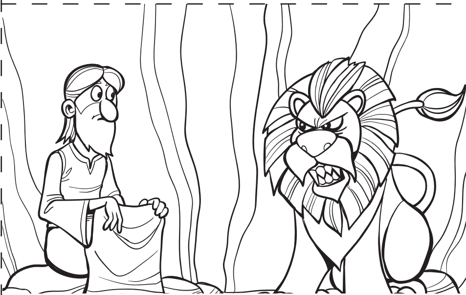
Daniel escogió orar a Dios aún en el foso de los leones.