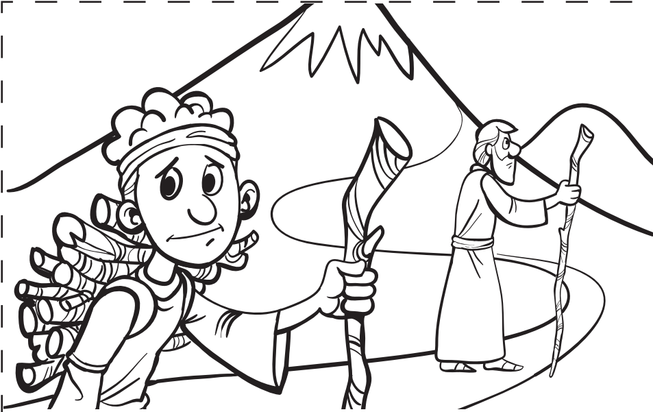
Abraham estuvo dispuesto a sacrificar a Isaac aún cuando no quería hacerlo.